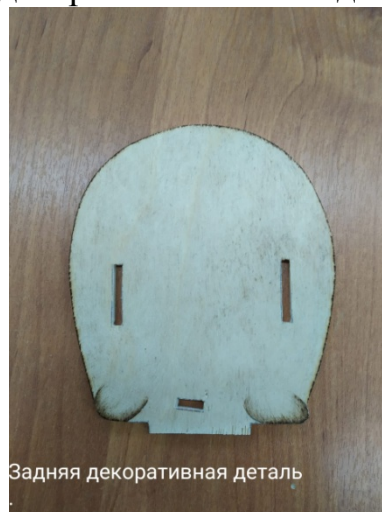
Задняя декоративная деталь