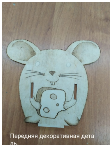
Передняя декоративная деталь.

- передняя декоративная часть -1 деталь;